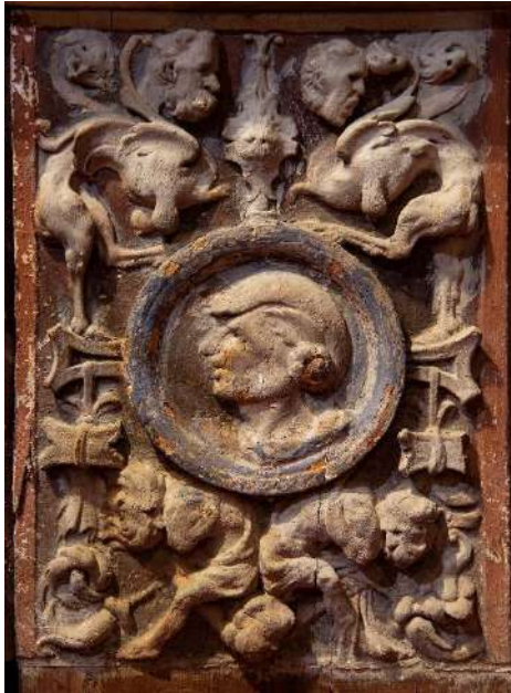
Fig. 11a. Panel ornamental. Martín de Vandoma, atribución. Hacia 1547/48-1550/51. Parroquia de San Miguel arcángel. Paracuellos de Jiloca.