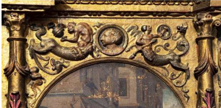
Figs. 12a-12b. Tableros con motivos ornamentales. Martín de Vandoma, atribución. Hacia 1547/48-1550/51. Parroquia de San Miguel arcángel. Paracuellos de Jiloca.