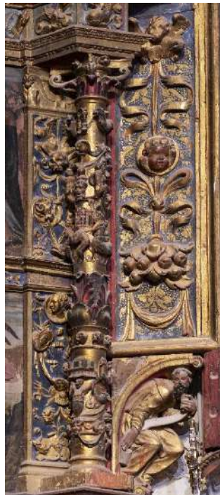
Figs. 13a (izquierda). Columna de orden gigante. Martín de Vandoma, atribución. Hacia 1547/48-1550/51. Parroquia de San Miguel arcángel. Paracuellos de Jiloca.