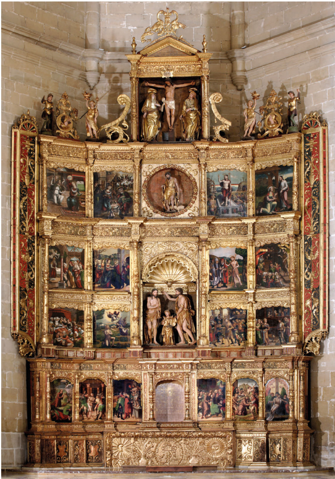
▪ Fig. 1. Esteban de Obray y Guillemín Leveque (mazonería); Gabriel Joly (atribuido a, imágenes); Pedro de Ponte y ¿Juan Giner? (pintura). Retablo mayor de San Juan Bautista de Cintruénigo. A partir de 1525.