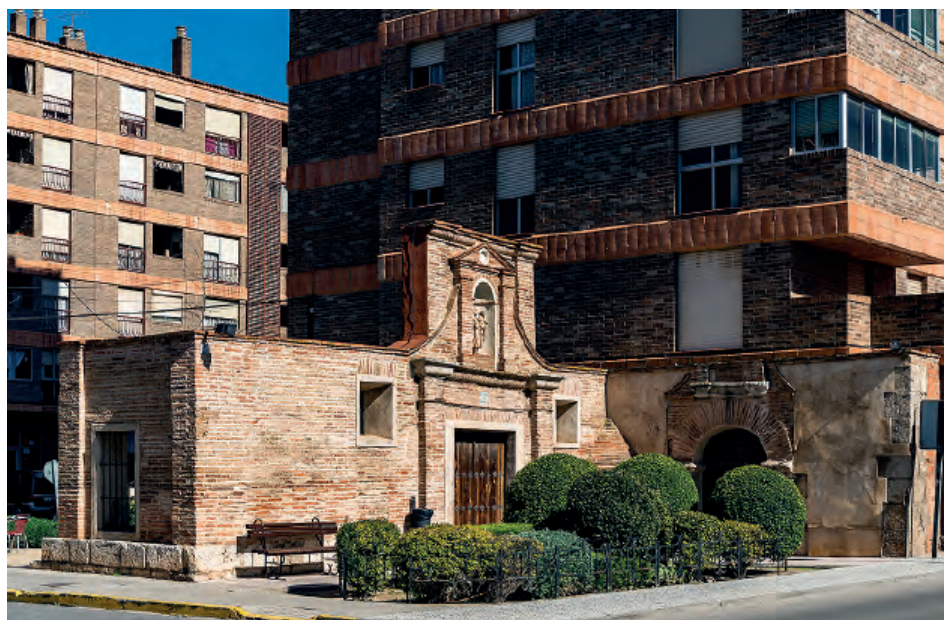
Fig. 3. Vestigios del convento de Madres Dominicas de San José.

tan sólo dos párrafos de este informe, el primero de los cuales hace referencia a las portadas: