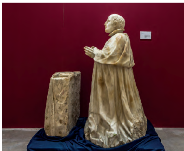
Fig. 2. Escultura orante del antiguo sepulcro de don José de Palafox. Francisco Franco, 1649. Calatayud, Museo de Santa María.