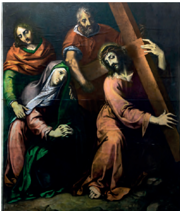
Fig. 1. Vía Dolorosa . Anónimo, primer cuarto del siglo XVII (paradero actual desconocido).