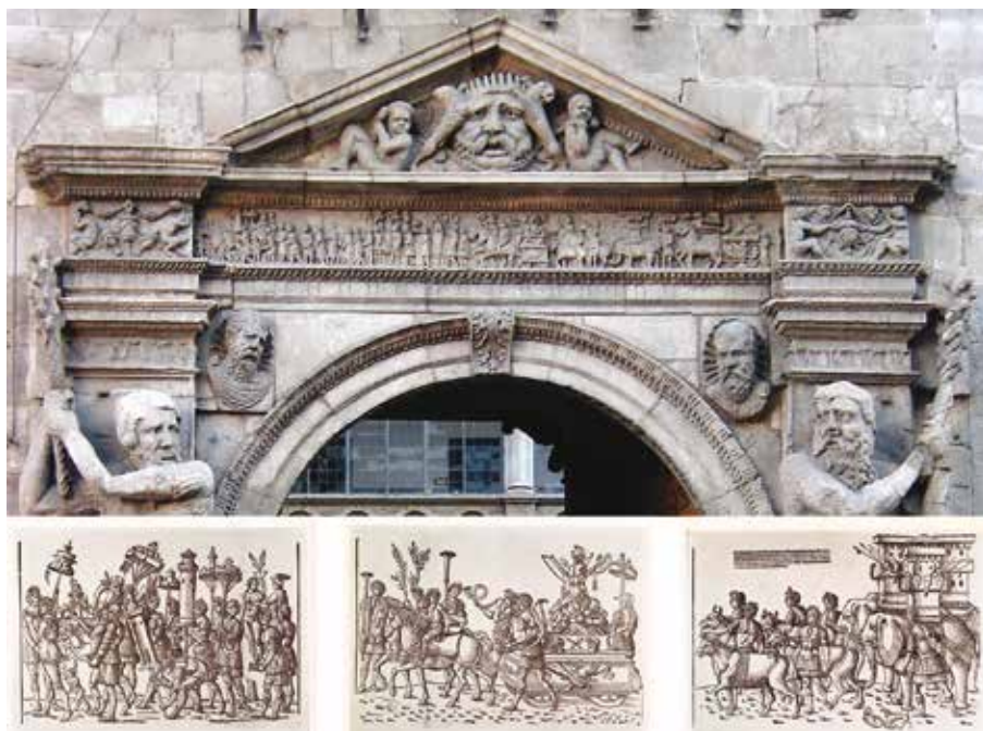
FIGURA 16. Contraposición entre el friso de la portada del palacio de los condes de Morata en Zaragoza y tres detalles de la serie del Triunfo de Julio César de Jacopo de Estrasburgo, 1503.