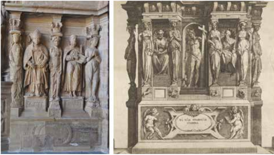
FIGURA 23. Derrame derecho de la portada de la catedral de N.ª S.ª de la Huerta de Tarazona, Bernal del Fuego, a partir de 1578. Alegoría de la fe (detalle), Cherubino Alberti sobre dibujo de Rosso Fiorentino, 1575.

Los dos últimos ejemplos corresponden al gran impacto que la portada de la editio princeps de la Regola delli cinque ordini d'architettura de Vignola tuvo en el ámbito del retablo español a partir de los años finales del siglo XVI, tanto en el contexto de lo que denominamos escultura romanista —que afecta a la mitad norte de la Península— como en otros. Este bello motivo se utilizó, en efecto, en numerosas oportunidades y, entre otras cosas, sirvió para articular mazonerías de pequeño formato como las dos que traemos a consideración.