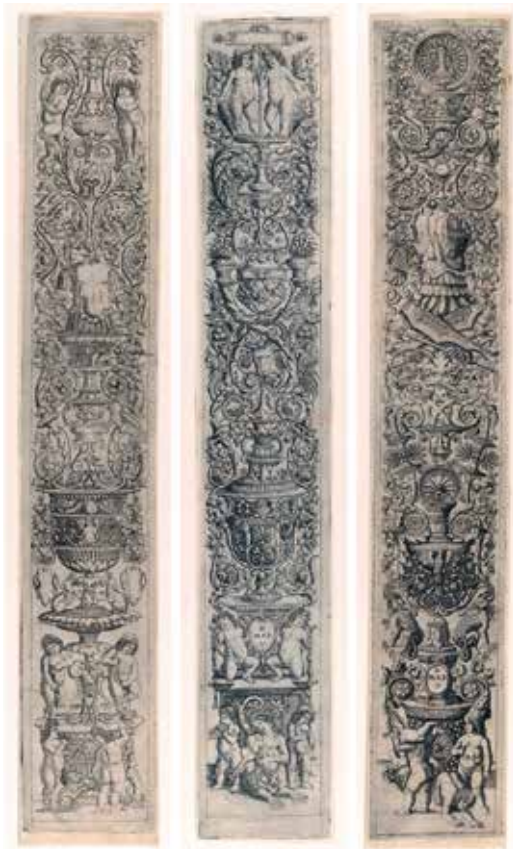
FIGURA I. Composición con Grutesco, Giovanni Antonio da Brescia, h. 1490-1515.

forma reductiva —y, sin ninguna duda, a partir de estampas— los ensayos que los artífices italianos estaban llevando a cabo para recuperar los fundamentos de la pintura de la antigua Roma. Aunque el resultado tiene poco que ver con las brillantes creaciones de Pinturicchio y otros artífices del momento 6 , las