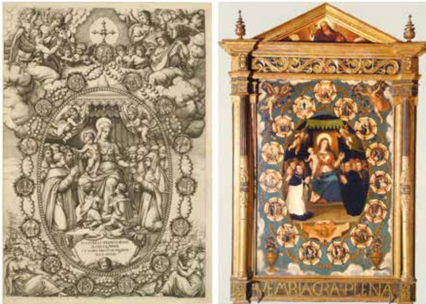
FIGURA 17. Alegoría del Santo Rosario , Nicolás Beatrizet, h. 1550. Retablo del Rosario, parroquia de San Miguel de Fuentes de Ebro, Guion Teatoris, 1559.