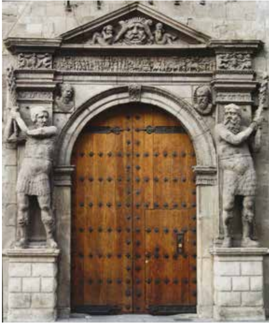
FIGURA 15. Portada del palacio de los condes de Morata en Zaragoza, Guillaume Brimbeuf, 1552. Foto: Francis Raher (fuente Wikimedia Commons).

Completaremos este elenco de ejemplos del Segundo Renacimiento con la portada del palacio de los condes de Morata de Zaragoza [fig. 15]. Encargada en 1552 al cantero y entallador francés Guillaume Brimbeuf 29 , su articulación a partir de los «gigantes» —o, como reza la capitulación «salvajes»— que la flanquean rezuma, no por casualidad, un cierto aire galo cercano a creaciones tolosanas. Pero lo que nos interesa ahora es el friso escultórico que preside su entablamento para el que, como advirtió Santiago Sebastián, se usó una serie de estampas grabadas en Venecia (en 1503) por Jacopo de Estrasburgo con el Triunfo de Julio César tras la campaña de la Galia 30 [fig. 16].