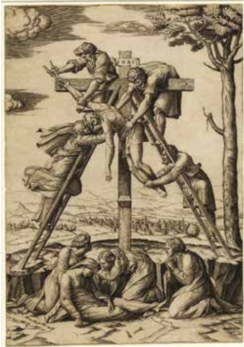
FIGURA 4. Descendimiento , Marcantonio Raimondi sobre dibujo de Rafael o su círculo, h. 1520-1530.