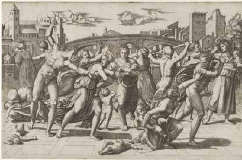
FIGURA 7. Matanza de los inocentes , Marcantonio Raimondi sobre dibujo de Rafael, h. 1512.