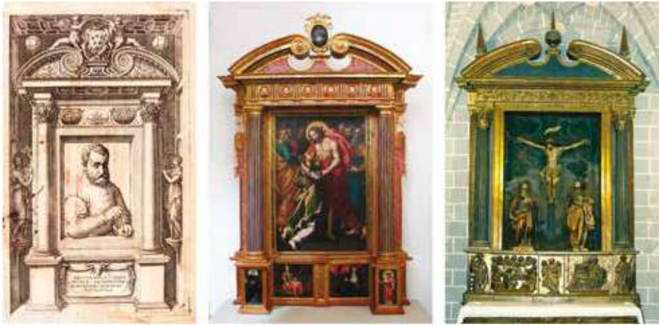
FIGURA 24. Regola delli cinque ordini d'architettura di M. Iacomo Barozzio da Vignola, [Roma, 1562], frontispicio. Retablo de Santo Tomás apóstol de la parroquia de la Asunción de la Virgen de Carenas, Jaime Viñola (atribuido), 1607. Retablo de la Sangre de Cristo de la parroquia de San Pedro en Catedral de Montón, Juan Velasco y Francisco del Condado, 1608.

1608 56 [fig. 24]. La dependencia de estas obras con respecto a la fuente es casi absoluta salvo por la comprensible transformación del zócalo del frontispicio de la Regola en la preceptiva predela con pinturas o relieves.