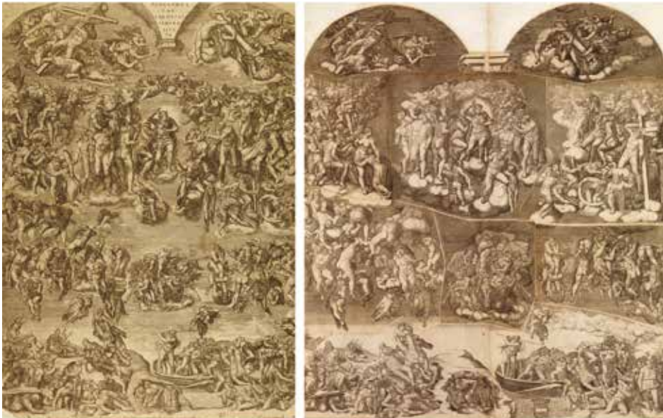
FIGURA 10. Juicio Final , Giulio Bonasone, h. 1546, y Giorgio Ghisi, h. 1545-1556, ambos sobre el original de Miguel Ángel para la Capilla Sixtina, h. 1536-1541.