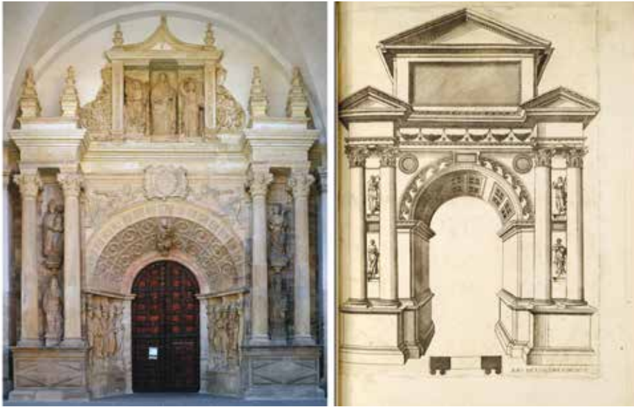
FIGURA 22. Portada de la catedral de N.ª S.ª de la Huerta de Tarazona, Bernal del Fuego, a partir de 1578. Jaques Androuet du Cerceau, Quinque et viginti exempla arcuum , 1549, Arc de l'ordre corinte .

que con probabilidad aportó el propio el artista, hijo del escultor normando Pierres del Fuego (doc. 1529-1566, †1566), afincado en la ciudad de Queiles en los años treinta y que, al parecer, se hallaba al corriente de las últimas novedades editoriales galas en materia de literatura artística.