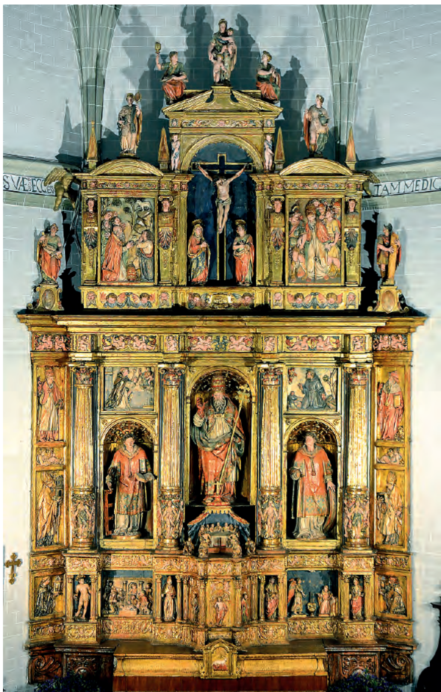
Fig. nº 2. Retablo mayor. Parroquia de La Muela.