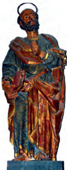
Fig. nº 13 a. San Pedro. Parroquia de Calatorao.