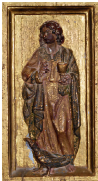
Fig. nº 16 b. San Juan Evangelista. Retablo del Dulce Nombre de Jesús de Velilla de Jiloca.