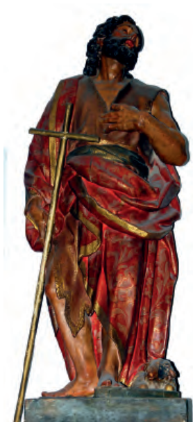
Fig. nº 15 a. San Juan Bautista. Parroquia de Calatorao.