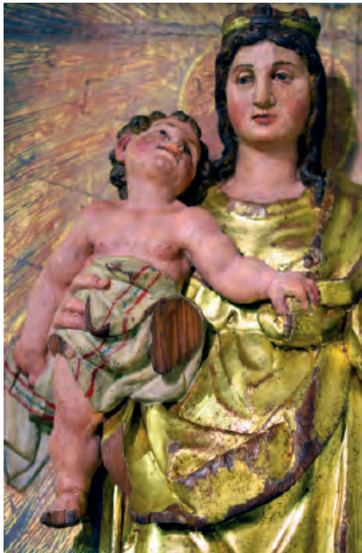
Fig. nº 12 a. Venida de la Virgen a Zaragoza, detalle. Parroquia de Calatorao.