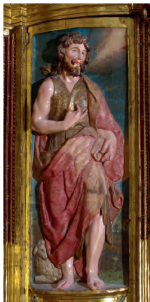
Fig. nº 15 b. San Juan Bautista. Retablo mayor de la catedral de Tarazona.