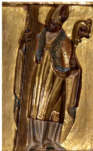
Fig. nº 19 b. Santo Obispo. Retablo del Dulce Nombre de Jesús de Velilla de Jiloca.