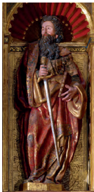
Fig. nº 14 b. San Pablo. Retablo mayor de la catedral de Tarazona.