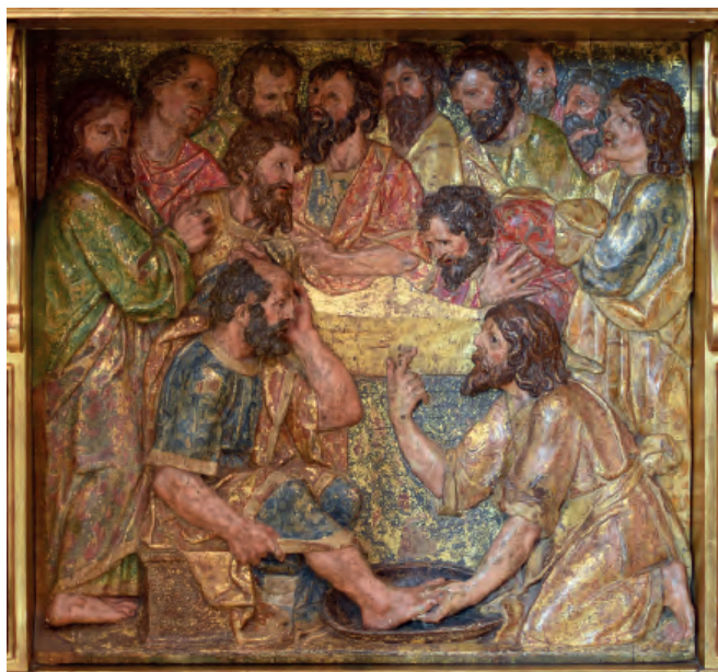
Fig. nº 9. Lavatorio de los pies. Parroquia de Calatorao.