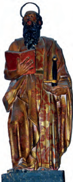
Fig. nº 14 a. San Pablo. Parroquia de Calatorao.