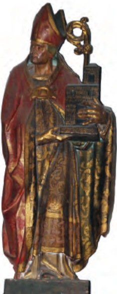
Fig. nº 19 a. San Agustín de Hipona. Parroquia de Calatorao.