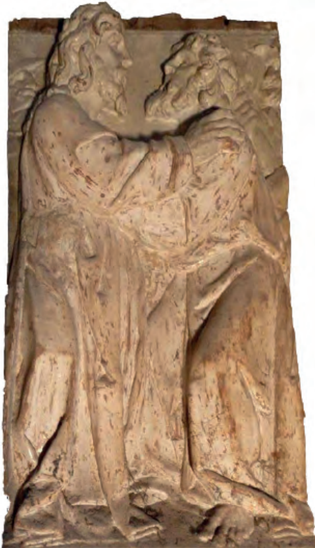
Fig. nº 4. Beso de Judas. Parroquia de Calatorao.