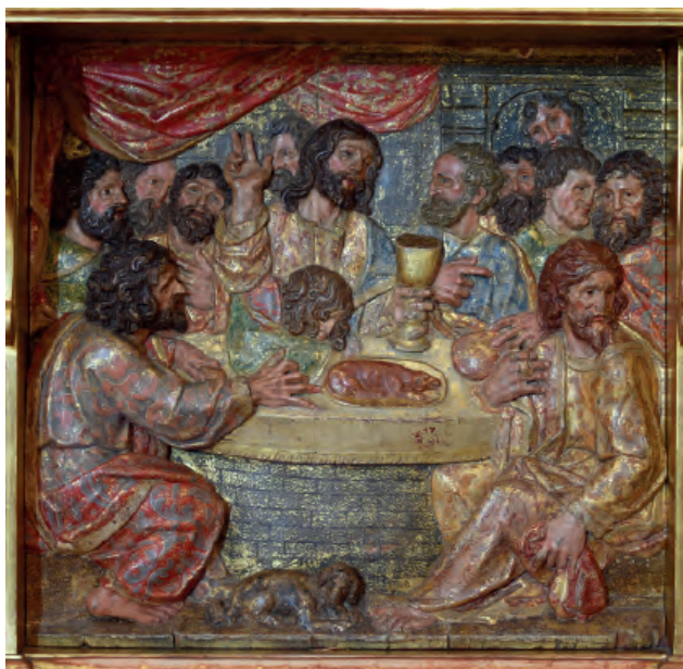
Fig. nº 10. Última Cena. Parroquia de Calatorao.

las primeras décadas del siguiente. Entre ellas citaremos la xilografía de la portada del Hic continetur quo modo et per quos edificata fuit ecclesia beate Marie maioris et de Pilari civitatis Ces[ar]auguste regni Aragonu[m] 47 (Zaragoza, 1542), aunque no hay duda de que en el medio siglo que dista entre esa fecha y la de la realización del retablo de Calatorao debieron abrirse algunas más.