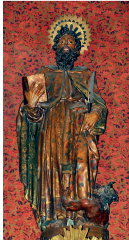
Fig. nº 1. San Bartolomé. Parroquia de Calatorao.

La visita pastoral cursada a la parroquia el 28 de abril de 1581 por Alonso Gregorio, vicario general y visitador