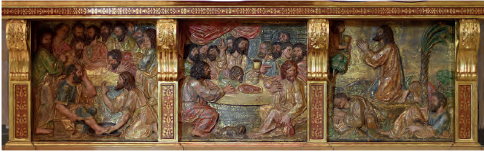
Fig. nº 3. Mesa del altar mayor. Parroquia de Calatorao.