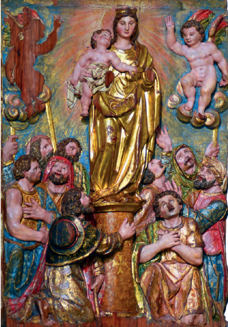
Fig. nº 11. Venida de la Virgen a Zaragoza. Parroquia de Calatorao.