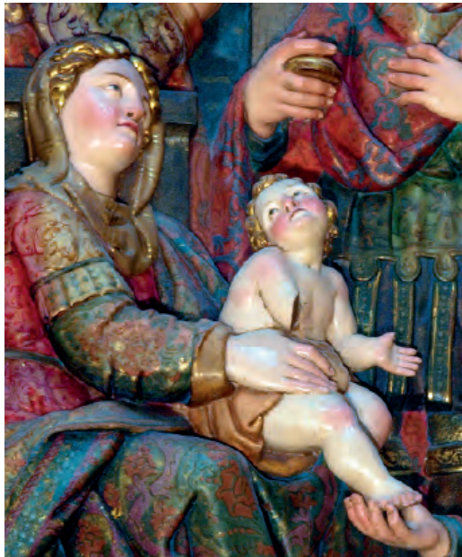
Fig. nº 12 b. Nacimiento, detalle. Retablo mayor de la catedral de Tarazona.

era extraño que el maestro confiara algunas imágenes a los ayudantes de más estatus, siempre a partir de sus bocetos. Así, San Pedro [fig. nº 13 a], que es una de las mejores, recuerda de cerca al apóstol homónimo del primer piso del cuerpo del retablo mayor de la Seo turiasonense [fig. nº 13 b], mientras que en el caso de San Pablo [fig. nº 14 a] la comparación con el apóstol de Tarso del retablo de Tarazona [fig. nº 14 b] es menos clara. 49 Y respecto a los Santos Juanes , puede proponerse la comparación entre el Precursor de Calatorao [fig. nº 15 a] y el tallado en una de las puertas del tabernáculo turiasonense [fig. nº 15 b], con unos fundamentos compositivos próximos que pueden extenderse también a su tono declamatorio, algo exagerado en Calatorao pero habitual en otras representaciones del personaje; por su parte, San Juan evangelista [fig. nº 16 a] cuenta con un posible paralelo en un relieve del retablo del Nombre de Jesús de Velilla de Jiloca [fig. nº 16 b] con el que, a pesar de todo, también presenta discrepancias significativas.