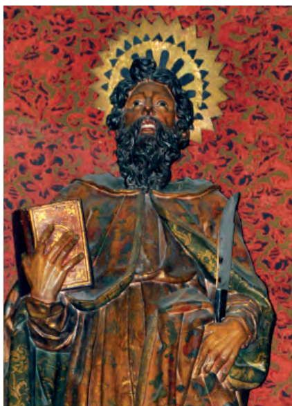
Fig. nº 7 a. San Bartolomé, detalle. Parroquia de Calatorao.