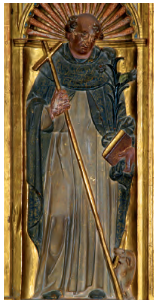
Fig. nº 17 b. Santo Domingo de Guzmán. Retablo de N a S a del Rosario de Velilla de Jiloca.