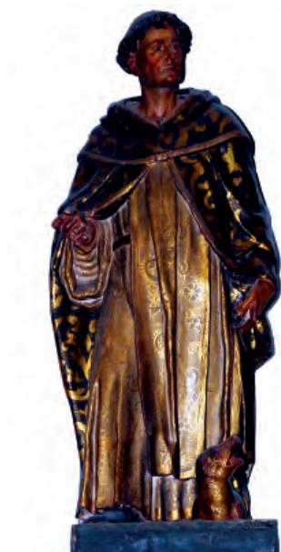
Fig. nº 17 a. Santo Domingo de Guzmán. Parroquia de Calatorao.