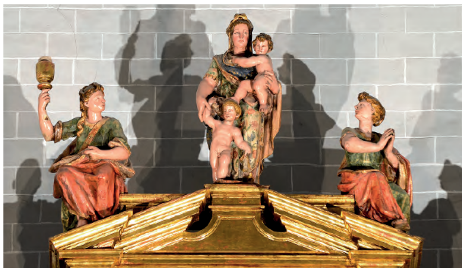
Fig. nº 6. Virtudes teologales, ático del retablo mayor. Parroquia de La Muela.

saron «que quanto al valor de la obra echa del dicho retablo bale mucho mas de los setecientos escudos que de conzierto se le dan al dicho Pedro Martinez» —doc. nº 4—. Aunque la suma es bastante inferior a la alcanzada por el retablo de La Muela —24.600 sueldos—, conviene recordar que en los 14.000 sueldos no estaba contemplada la policromía, cuya materialización solía suponer una inversión similar o incluso superior a la de la máquina «en blanco».