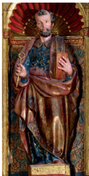
Fig. nº 13 b. San Pedro. Retablo mayor de la catedral de Tarazona.