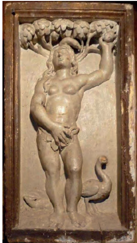
Fig. nº 5. Eva. Parroquia de Calatorao.