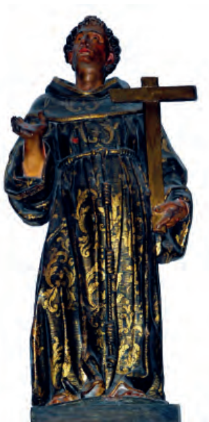
Fig. nº 18. San Francisco de Asís. Parroquia de Calatorao.