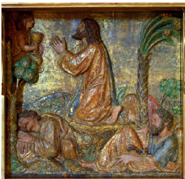
Fig. nº 8. Oración en el huerto de Getsemaní. Parroquia de Calatorao.