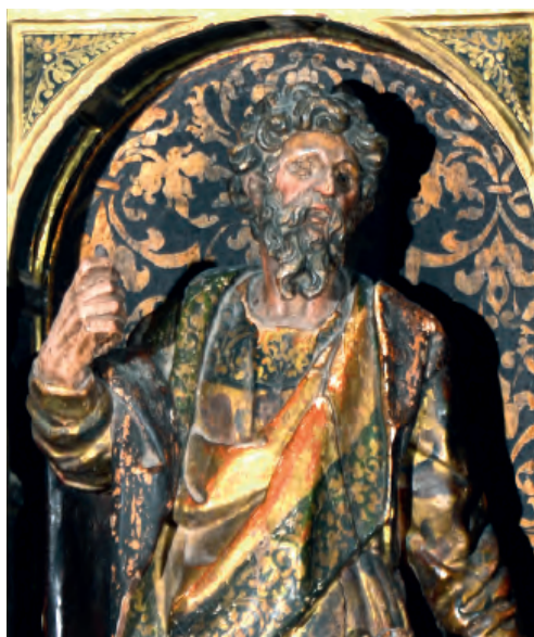
Fig. nº 7 b. San José, detalle. Parroquia de Alarba.

Última Cena [fig. nº 10]. No hay que descartar un posible recurso a grabados para pergeñar estas historias.