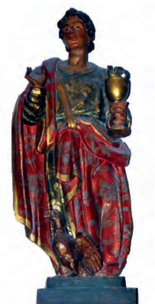
Fig. nº 16 a. San Juan Evangelista. Parroquia de Calatorao.