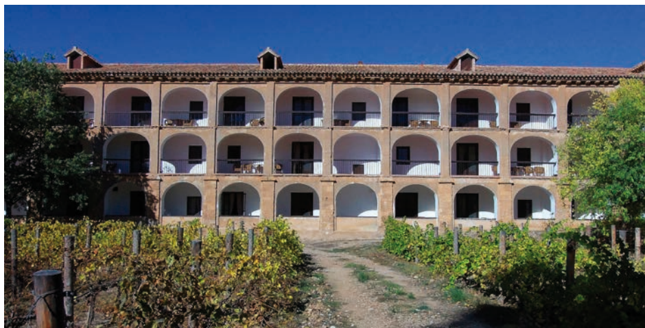
Lám. 85. Vista del exterior de las antiguas celdas del Monasterio de Piedra.