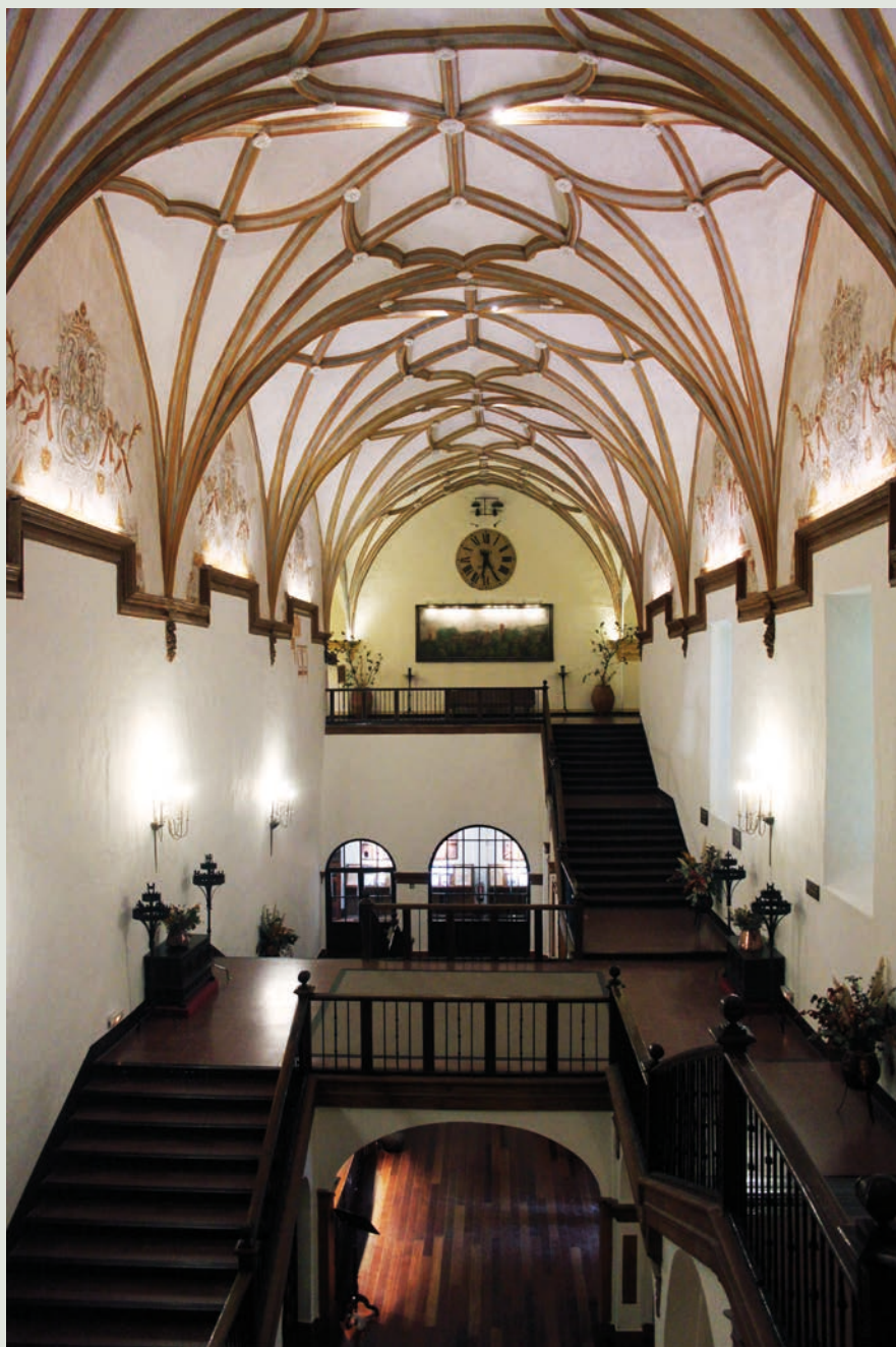
Lám. 83. Escalera del Monasterio de Piedra, antigua enfermería de época de don Hernando de Aragón.