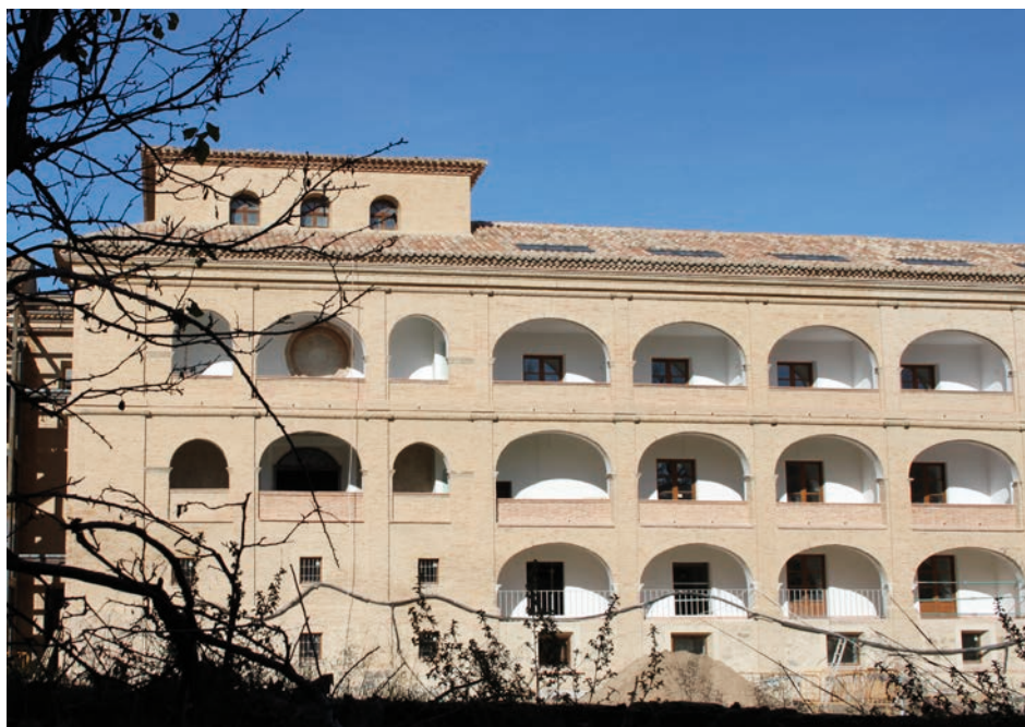
Lám. 84. Exterior del Monasterio nuevo de Santa María de Veruela.