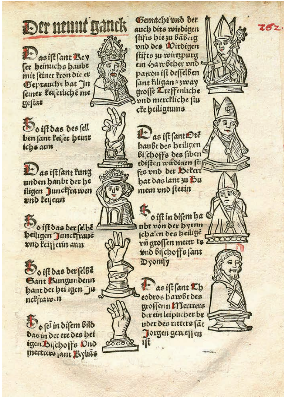
Fig. 2. Folio de In diesem puchlein stet verzeichnet das hochwürdig heiltum das man do pflegt alle mal vber sibem Jare ein mal zu Bamberg zu weisen , Nürnberg, 1493.