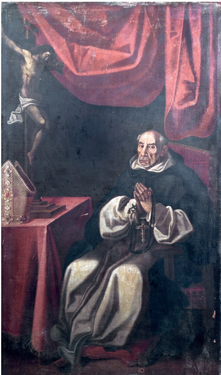
Fig. 1. Retrato de Fray Juan López de Caparroso, pintor de Italia meridional. Hacia 1605. Museo de la Colegiata de Borja.