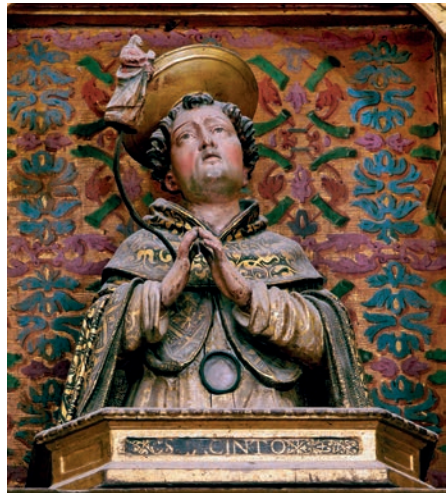
Fig. 15. Busto-relicario de San Jacinto. Giovan Battista Gallone. Hacia 1608. Colegiata de Borja.