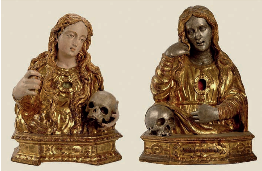
Fig. 5. Bustos-relicario de Santa María Magdalena. Segundo y Primer taller napolitano. Museo Nacional de Escultura de Valladolid.

napolitana han destacado una intensa colaboración entre distintos obradores. El segundo taller tiende a la simplificación de los vestidos y frecuentemente los rostros —que en el primer grupo son plateados— son ligeramente alargados, gozan de pieles tersas y juveniles, y están pintados con expresiones más dulces e idealizadas 25 . La diferencia entre ambos talleres es fácilmente observable en las representaciones de Santa María Magdalena [fig. nº 5] y Santa María Egipcíaca, de las que se conservan sendas representaciones de uno y