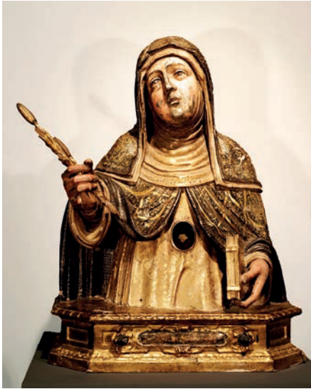
Fig. 12. Busto-relicario de Santa Catalina de Siena. ¿Giovan Battista Gallone? Hacia 1608. Museo de la Colegiata de Borja.