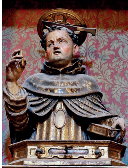
Fig. 11. Busto-relicario de San Pedro Mártir. Giovan Battista Gallone. Hacia 1608. Colegiata de Borja.

Aunque no consta documentalente que los bustos-relicario de Borja se trajeran de Nápoles no se puede dudar sobre su origen por lo que se ha señalado y por el estilo de las imágenes, tan característico. También los brazos-relicario son napolitanos y basta compararlos con los conservados en el Museo Nacional de Escultura de Valladolid —procedentes de los legados del duque de Lerma a los conventos vallisoletanos— o con los de las clarisas de Monforte de Lemos. Unos y otros comparten una peculiar tipología en la que los brazos propiamente dichos se levantan sobre una basa de diversas molduras, con diferentes adornos sobrepuestos, que concluye en una corona. Los de Borja son prácticamente iguales a los de la iglesia de Santa Maria Assunta en Cropani (Catanzaro, Calabria) que se han adjudicado precisamente al taller de Gallone 91 .