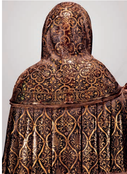
Fig. 13. Busto-relicario de Santa Catalina de Siena, detalle de la policromía. Giovan Battista Gallone. Hacia 1608. Museo de la Colegiata de Borja.