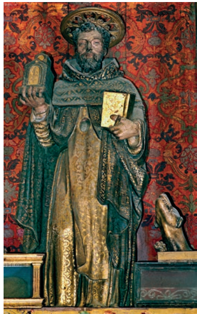
Fig. 17. Imagen-relicario de Santo Domingo de Guzmán. Giovan Battista Gallone. Hacia 1608. Colegiata de Borja.