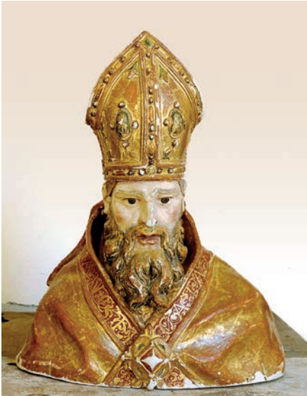
Fig. 3. Busto-relicario de San Cataldo de Tarento. Taller italiano. Hacia 1585. Monasterio de Santa Clara de Medina de Pomar.