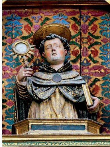
Fig. 16. Busto-relicario de Santo Tomás de Aquino. Giovan Battista Gallone. Hacia 1608. Colegiata de Borja.

Al menos los cuatro medios cuerpos mayores tuvieron en un principio encarnación plateada que se aprecia