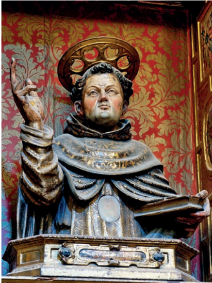
Fig. 10. Busto-relicario de San Vicente Ferrer. Giovan Battista Gallone. Hacia 1608. Colegiata de Borja.