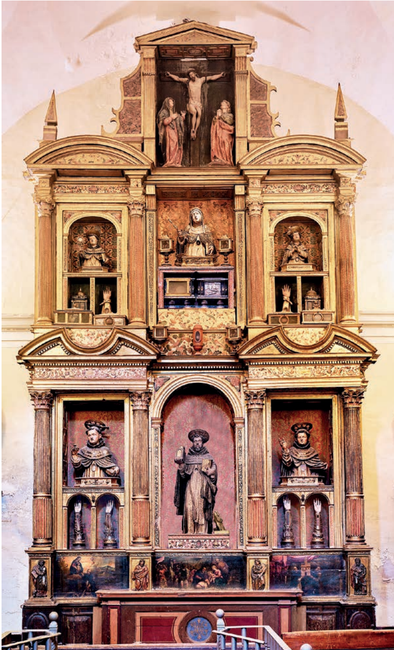
Fig. 9. Propuesta de reconstrucción del estado original del Retablo de Santo Domingo de Guzmán.