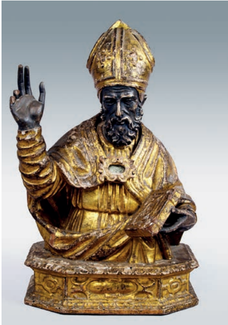
Fig. 7. Busto-relicario de San Germán. Taller de Aniello Stellato. Museo Diocesano de Arte Sacro. Bilbao.

Medina, y otros que donó en testamento a la colegiata de Berlanga, al taller napolitano que de modo más activo trabajó para el duque de Lerma, el taller de Aniello Stellato que, según son los resultados en Medina y Valladolid, repartió las obras entre bastantes manos.