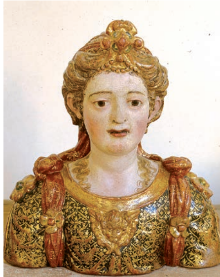
Fig. 4. Busto-relicario de una virgen mártir. Taller de Lombardía. Monasterio de Santa Clara de Medina de Pomar.