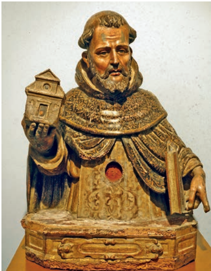
Fig. 14. Busto-relicario de Santo Domingo de Guzmán sin reliquia. Giovan Battista Gallone. Hacia 1608. Museo de la Colegiata de Borja.